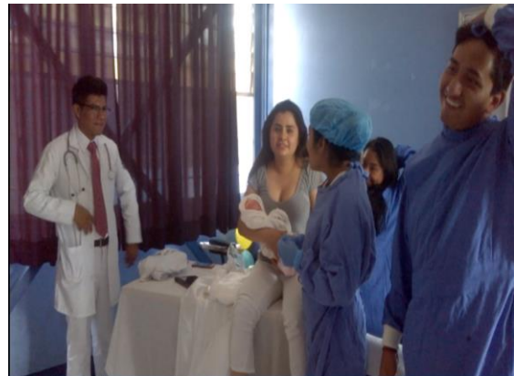
Anexo 12. Role playing (Parto).