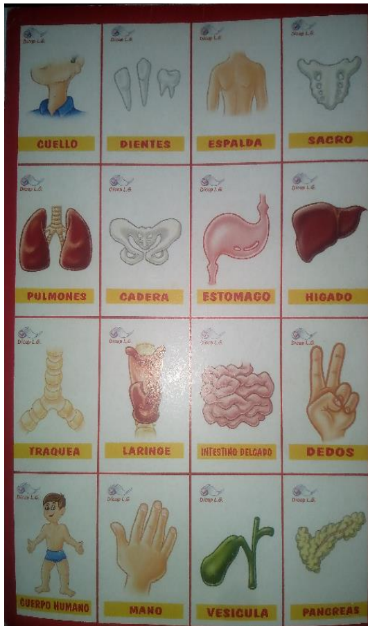
Anexo 1. Lotería, vocabulario técnico y coloquial del cuerpo