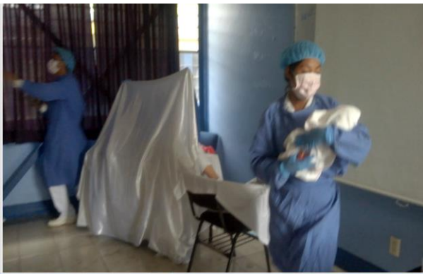
Anexo 11. Role playing (Parto).