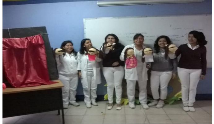
Anexo 14. Role playing con títeres. (Esquizofrenia)