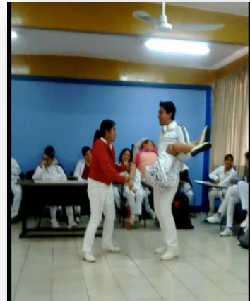
Anexo 17. Role playing (Adulta mayor con fractura de cadera).