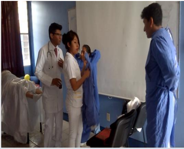
Anexo 9. Role playing , (Parto).