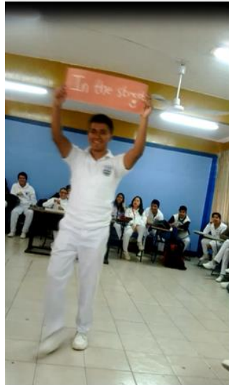
Anexo 16. Role playing (Adulta mayor con fractura de cadera).