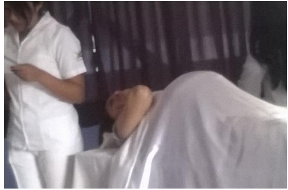
Anexo 10. Role playing (Parto).