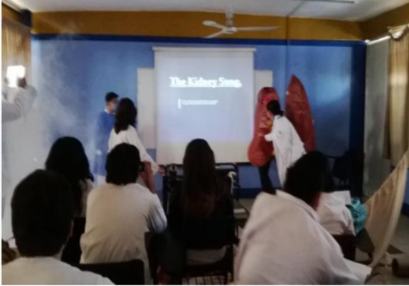
Anexo 13. Role playing (Falla renal)