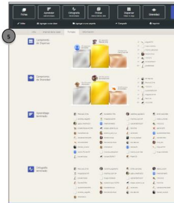
[5] La gráfica presenta la información de desempeño del grupo en cada una de las secciones que integra la aplicación. Esta información es muy útil porque permite ver el avance y práctica realizada en cada sección.