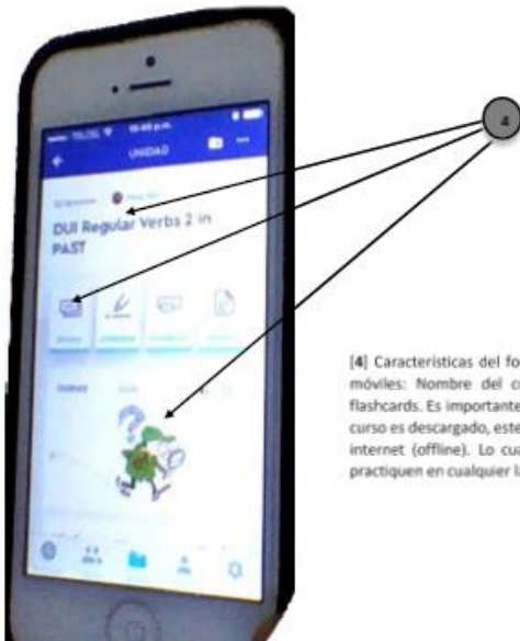
[4] Características del formato del curso en dispositivos móviles: Nombre del curso, formas de interacción y flashcards. Es importante mencionar que, una vez que el curso es descargado, este puede ser usado sin conexión a internet (offline). Lo cual permite que los estudiantes practiquen en cualquier lado sin depender de red.